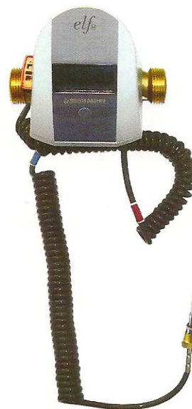
Рисунок 2 - Внешний вид теплосчетчика