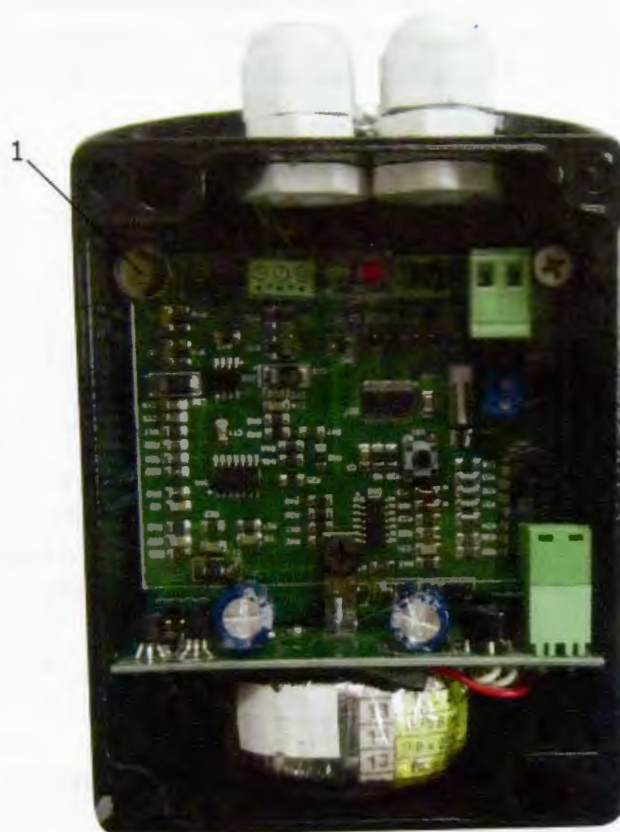
Рисунок 4 – Место пломбирования

1– чашка для мастичной пломбы, исключающей несанкционированный доступ к элементам электрической схемы и технологическому разъёму.