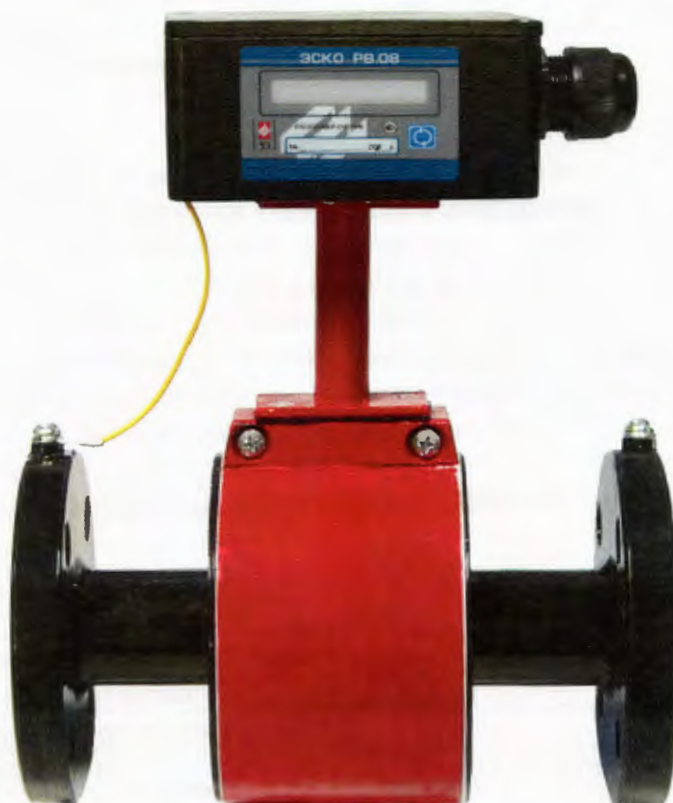
Рисунок 3 - Общий вид

Место пломбирования расходомера-счётчика электромагнитного ЭСКО-РВ.08 приведено на рисунке 4.